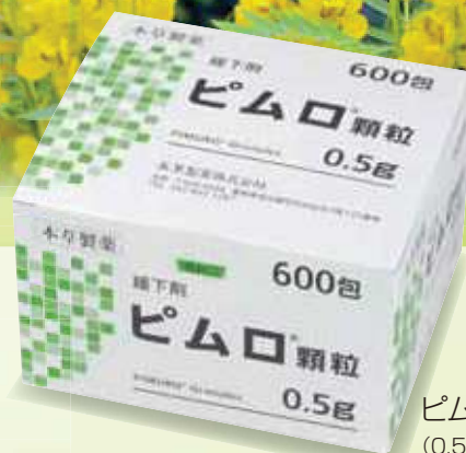
ピムロ顆粒: 300g (0.5g x 600包)